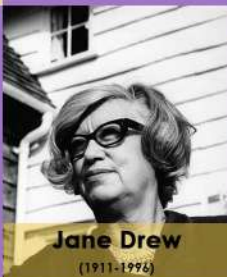
Jane Drew (1911-1996)

Arquitecta promotora del Movimiento Moderno . Luchó por construir viviendas sociales en África Occidental, Asia y en su propio país.