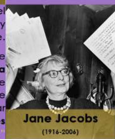
Jane Jacobs (1916-2006)

"Ha de haber siempre ojos que miren a la calle , ojos de las personas que podríamos considerar propietarios naturales de la calle ."