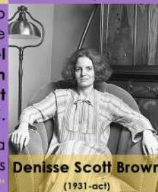
Denisse Scott Brown (1931-act)

"En la arquitectura hace falta menos ego y más miedo."