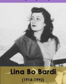
Lina Bo Bardi (1914-1992)

Además, accedió al grado militar de Comandante de Aviación .