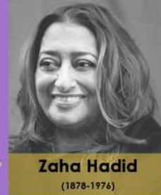
Zaha Hadid (1878-1976)

"Para crear, uno antes debe cuestionarlo todo."