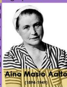
Aino Masio Aalto (1894-1949)

Realizó importantes proyectos con Alvar Aalto atribuidos solo a él en un primer momento.