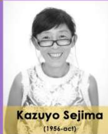
Kazuyo Sejima (1956-act)

Le Corbusier la recibió con la frase "desgraciadamente, aquí no bordamos cojines ".