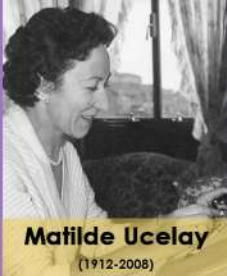
Matilde Ucelay (1912-2008)

El COAM sigue sin reconocer su trayectoria tras 2 acuerdos de JR propuestos por ADN COAM para darle su nombre a uno de sus espacios.