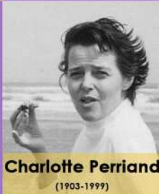
Charlotte Perriand (1903-1999)

"Lo que funciona bien es mejor a lo que se ve bien, porque lo que funciona bien permanece en el tiempo ."